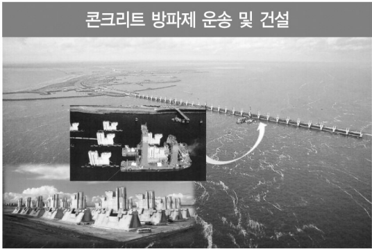
콘크리트 방파제 운송 및 건설

에 설치했다. 그런 다음 방파제를 매트리스에 고정하고 내부 공간을 모래로 채워 안정성을 강화했다. 그리고 돌을 여러 층으로 쌓은 받침돌을 방파제의 기단 주변에 설치했다. 이 공정에 모두 500만톤의 돌 받침이 사용되었다. 다음 작업은 방파제들을 콘크리트 받침으로 연결하고, 그 위에 상자형 들보 다리를 놓아 도로를 만드는 일이었다. 물론 이동식 철문도 끼웠다. 문들은 두께 5m에 폭이 40m이며, 높이는 방벽에서의 위치에 따라 6~12m로 다양하다. 가장 큰 문은 삼각주의 가장 깊은 곳에 설치한 무게 480톤짜리다. 문을 여닫는 데는 한 시간 가량이 걸리며, 수시로 점검한다. 방벽은 평균 1년에 두 번, 수위가 높아질 때 닫히는데 그 효과는 과연 탁월했다. 동부 스텔더 해일 방벽은 1987년에 공식적으로 완공되었다. 이런 방식으로 바다를 막은 설비는 세계에서 유일하며, 네덜란드의 대부분 지역을 안전하게 보호해 주고 있다. 또한 삼각주 일대의 환경 관리에도 도움을 주고, 섬들 간의 교통을 원활히 해주며, 여가 용도로도 크게 기여한다. 이 설비는 현대적이고 기술적으로 발달한 구조물이지만, 주변 환경과도 아주 잘 어울리는 것으로 평가된다.